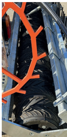
Rodillo Otico Farmflex