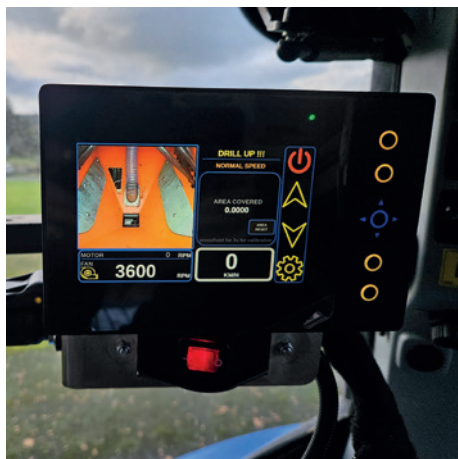
E Drive Pantalla táctil de 7

*con gradas puede hacer siembra de ranura y raspado