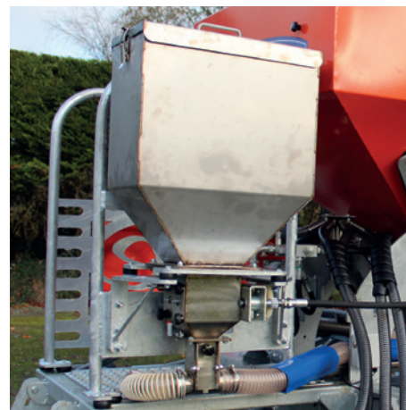
Tolva secundaria en el modelo plegable de 4 m