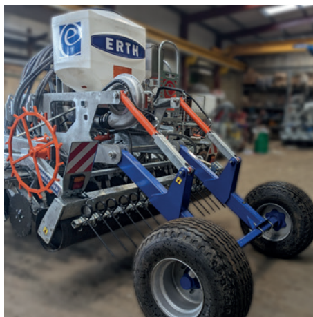
Kit de arrastre