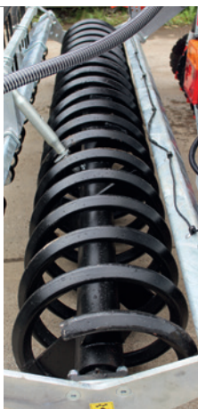
Rodillo de bobina de 18